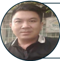
PHÓ BAN LUCA BÙI VĂN XUYÊN

Thủ quỹ: Giáo hạt Hữu Lễ SDT: 0378.573.480