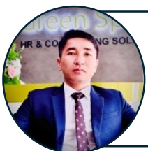
PHÓ BAN GIUSE MAI ĐỨC THANH

Phó nội vụ: Giáo hạt Chính Tòa SDT: 0908.411.618